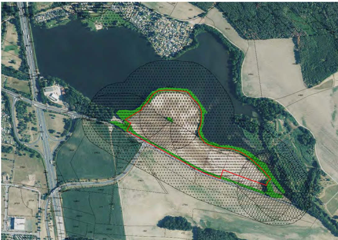
Abb. 2: Karte Feldlerche – Abstände zu Vertikalbeständen

Im Ergebnis kann festgehalten werden, dass das Plangebiet vollständig innerhalb des Bereiches liegt, wo die Feldlerchen auf Grund des vorhandenen Gehölzbestandes (Meidung von Vertikalstrukturen) keine Brutplätze anlegen. Für die Wachtel kann auf Grund des Mindestabstandes von 200 m eine Brut ausgeschlossen werden.