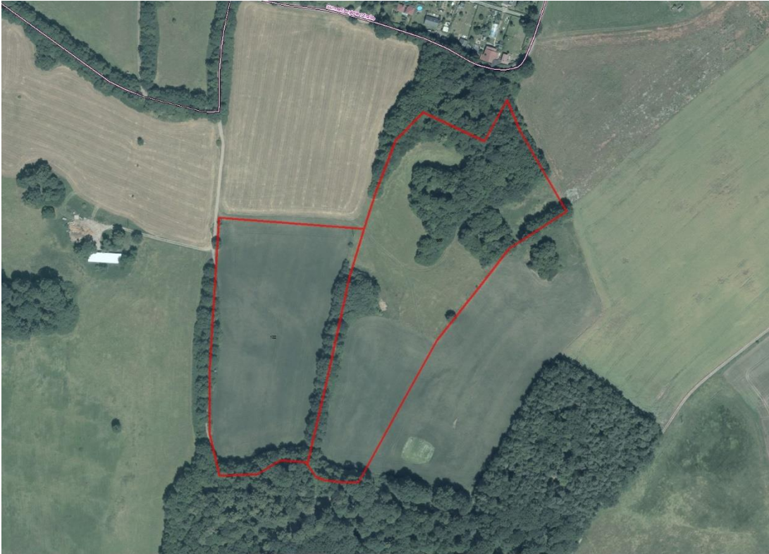
Geobasisdaten: © GeoBasis-DE / BKG (2021). Nutzungsbedingungen: http://sg.geodatenzentrum.de/web_public/nutzungsbedingungen.pdf . © GeoBasis-DE / BKG 2020 (Daten verändert), www.bkg.bund.de ; Lageskizze