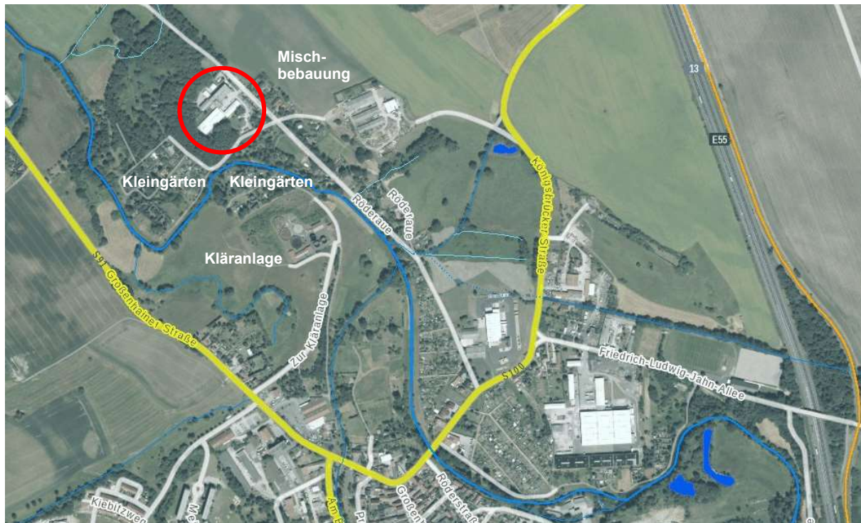
Abbildung 1: Lage Plangebiet im Luftbild

Das Plangebiet umfasste eine knapp 2 ha große Fläche am nördlichen Stadtrand von Radeburg, nördlich der Großen Röder. Der Betriebsstandort ist südlich und westlich von bewaldeten Flächen umgeben. Etwas südlich und östlich liegen mehrere Kleingartenanlagen, von denen jedoch einige nicht mehr aktiv genutzt werden. Nördlich grenzt an den Standort ein schmaler Streifen mit Mischbebauung an, dahinter folgen landwirtschaftlich genutzte Flächen.