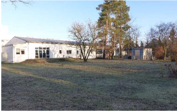
Foto 7: Südöstliche Halle mit angrenzenden Freiflächen innerhalb des Betriebsgeländes