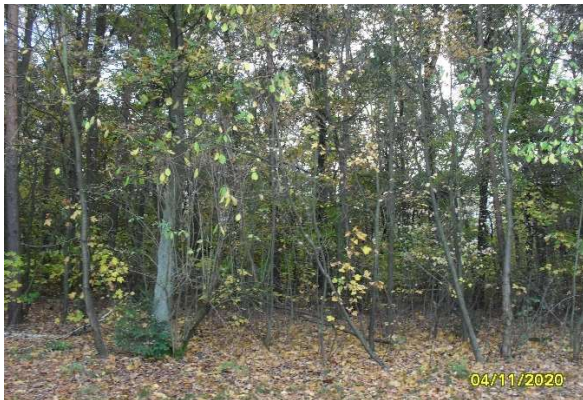
Foto 1: aufwachsender Laubmischwald in den Randbereichen des Plangebietes

einen Biotopwert von 20 auf. Die Gehölzbestandenen Gärten haben eine mittlere Bedeutung für die Biotopbewertung.